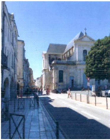
～ラ・ロッシュェルの街～