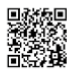
パートナーシップ宣誓制度 ホームページ

法律上の婚姻とは異なるため、法的な効力はありませんが、パートナーシップ制度の導入により、性的マイノリティをはじめとする多様性への理解がすすみ、差別や偏見のない誰もが自分らしく安心して暮らせるまちの実現を目指します。宣誓を希望される方は、市ホームページもご覧ください。▶▶▶▶