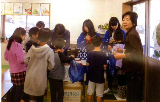
▼ おなり子どもの家の行事 「おなり秋まつり」