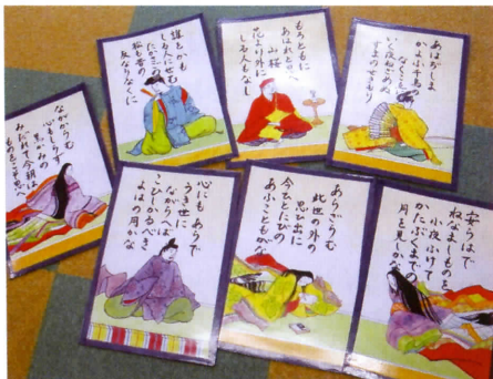
◀ 手作りの大型カード (百人一首かるた)

おなり子どもの家の登録者数は96人。多いときは70人くらいの子供たちが一緒に過ごします。指導員はアシスタントを含め5~6人で対応しています。