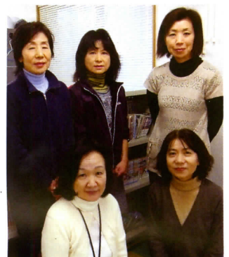
おなり子どもの家の指導員さんたち

「お母さんは疲れているから心配をかけないようにと、気をつけているお子さんもいます。保護者の方に子どもの家での様子をお伝えすると、学校や家庭では見せたことのない一面に驚かれることもありますね」