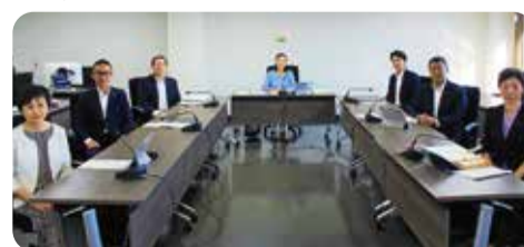
決算等審査特別委員会