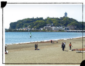
腰越海水浴場 MAP H