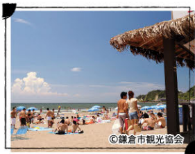
由比ガ浜海水浴場 MAP C-4