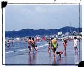
材木座海水浴場 MAP C-4