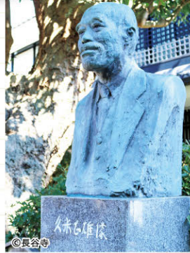
長谷寺 M.P.B.B. 江戸電長谷駅より徒歩約5分 久米正雄の胸像(長谷寺)。久米は関東大震災の際、長谷寺に避難しました。

昭和35年頃から始まった宅地開発の波が、聖域である鶴岡八幡宮の裏山「御谷」にまで押し寄せました。これに対して市民とともに鎌倉文士らも反対運動後に御谷騒動と呼ばれるのを推進し、大佛次郎(小説家)を中心となって鎌倉の自然と文化財を守る「鎌倉風致保存会」を設立。これが契機となって昭和41年「古都保存法」が制定され、京都や奈良などとともに鎌倉も乱開発から守られることとなりました。