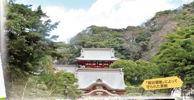
「御谷騒動」によって守られた景観