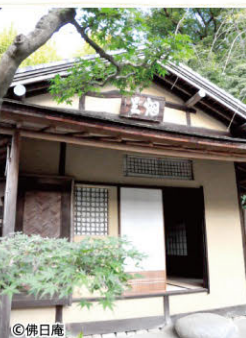
円覚寺塔頭佛日庵 M.A.C.O. JR北鎌倉駅より徒歩約2分 佛日庵の茶室「烟足軒」。この茶室前に植えられた枝垂れ桜は、大佛次郎夫人から贈られたもの。

川端康成(小説家)は昭和10年より居住し、その作品の中に鎌倉の情景を美しく描きました。小説「山の音」では「鎌倉のいはゆる谷の奥で、波が聞える夜もあるから、信吾は海の音かと疑ったが、やはり山の音だった」(「山の音」より)。また小説「千羽鶴」冒頭の茶会シーンは、円覚寺塔頭佛日庵境内にある茶室「烟足軒」が舞台です。