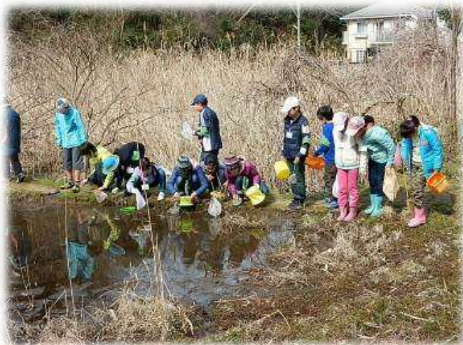
緑のレンジャー (ジュニア) による活動 (鎌倉中央公園)