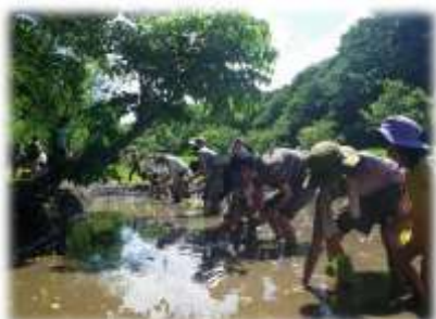
農業体験（鎌倉広町緑地）

※（ ）内は対象の世代を表します。 幼年期 0～5 歳、少年期 6～14 歳、 青年期 15～24 歳、壮年期 25～44 歳、 中年期 45～64 歳、高年期 65 歳～ 「厚生労働省健康日本 21 総論より」