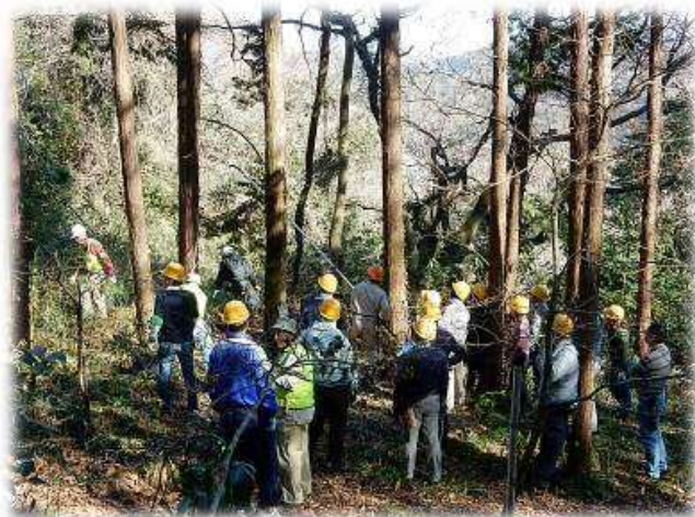
緑のレンジャー (シニア) による活動 (源氏山公園)