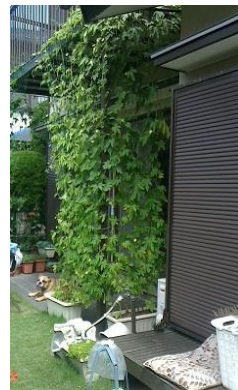
講座参加者のご自宅の 緑のカーテン

令和元年(2019年)5月30日にゴーヤ栽培の専門知識を有する講師の方にゴーヤの栽培方法についてご講義いただきました。参加していただいた50名の方にゴーヤ苗を一人8株ずつ配布し、緑のカーテンの普及を図りました。令和元年に事業状況の見直しを行い、令和元年度をもって終了しました。