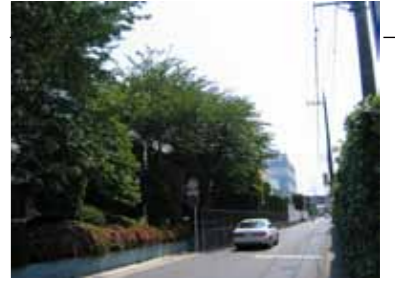
敷き際の豊かな緑化空間