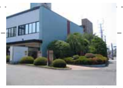
緑視効果の高い緑化デザイン