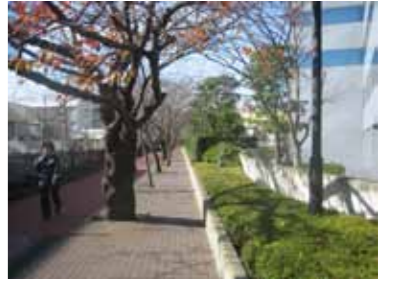
歩行者に配慮した敷き際のしつらえ