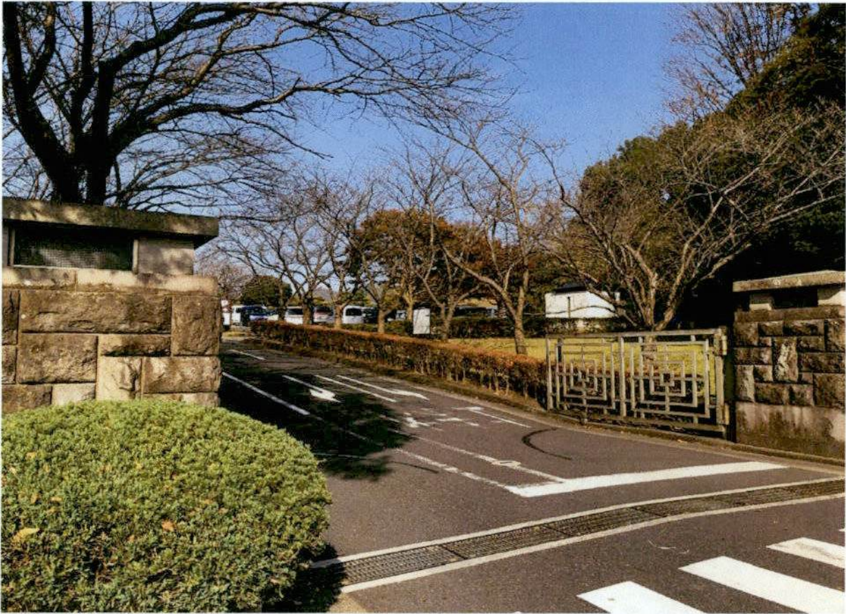
南側道路境界（正門）から