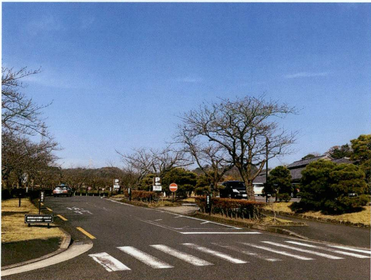
計画地付近（敷地内）南西から