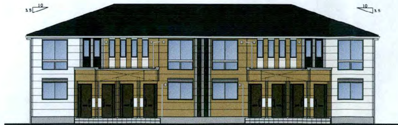
南 立面図 S=1:100

アクセント色【オレンジ】 リシエルストーン オールドMGブラウン MFX814C 7.5YR (7/3) 共通色【ブラック】 ステディストーン エミュMGブラック MFX699 5YR 3/1 屋根色【ネオブラック】 ココナッツブラウン 10R 3.0/0.5 玄関ドア色【ゼブラチャコール】 5.8G 2.6/0.6 ベース色【ホワイト】 スノーMGホワイト WFX561 2.5YR (9/1) ポーチ色【ホワイト】 CBD300/32 8.2YR 6.0/1.1