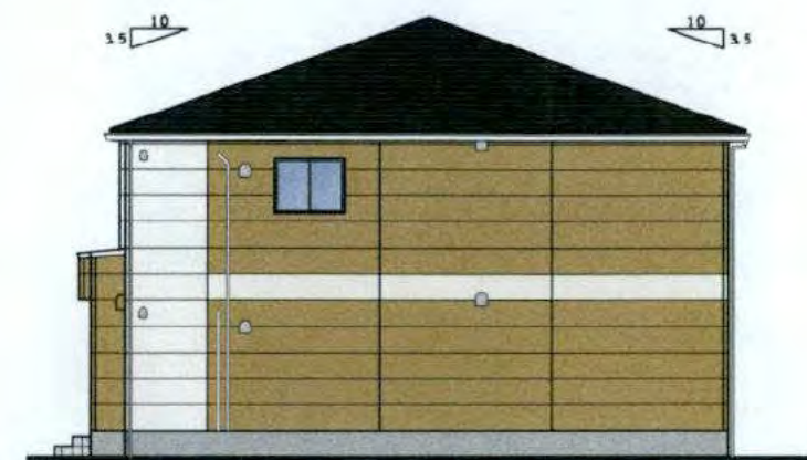
東 立面図 S=1:100