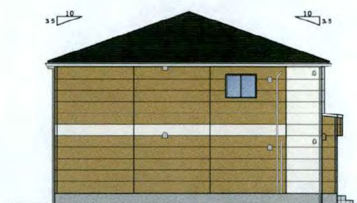
西 立面図 S=1:100

※ウェザータイト施工部位は室外機目隠し壁及びバルコニー手摺の天端と、雨がかりとなるダクト・給気口・クーラースリーブの廻りとする。