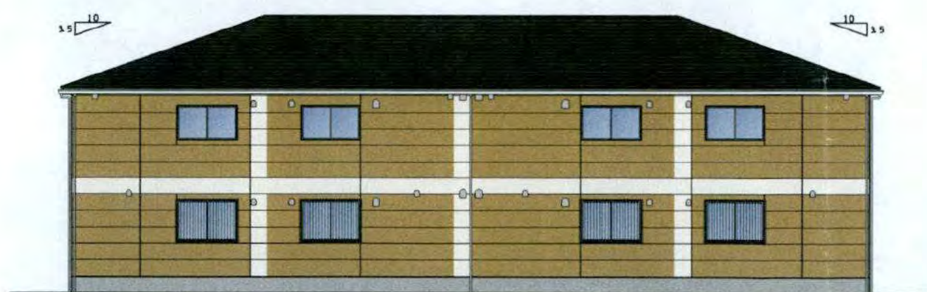
北 立面図 S=1:100