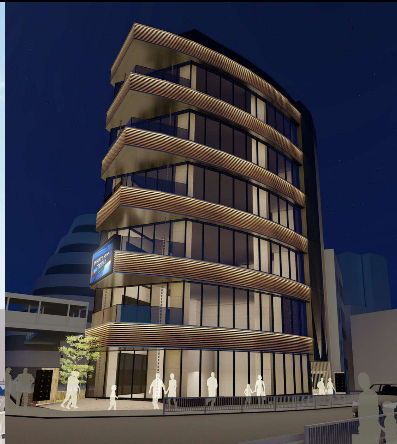
02. 南面外観イメージ【夜】

設置予定の屋外広告物（LEDビジョン）は、景観配慮協議の対象外ですが、別途、都市景観課と協議します。