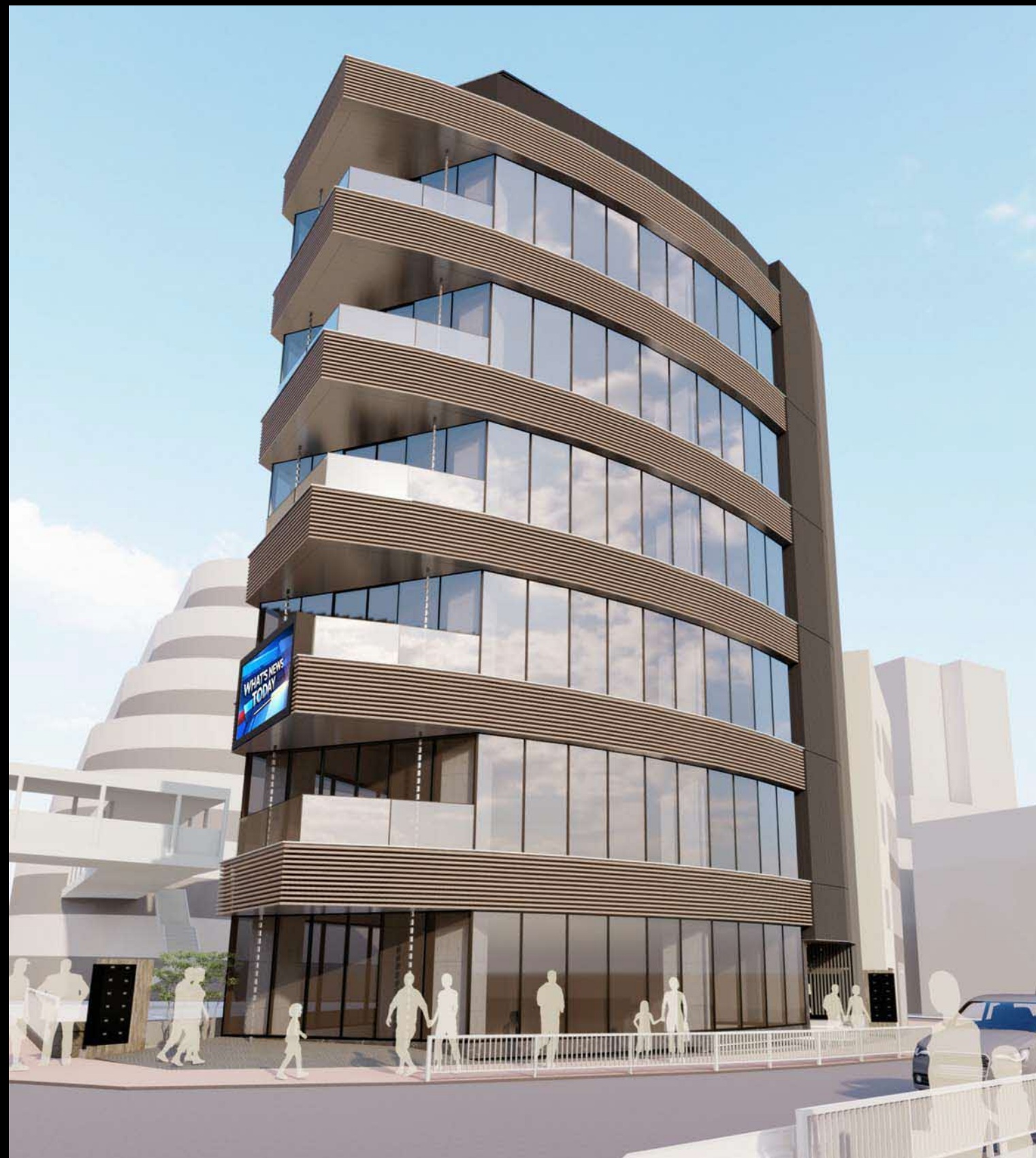
01. 南面外観イメージ【昼】