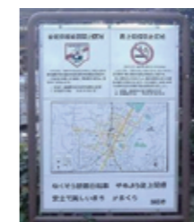
路上喫煙禁止区域の掲示板 (H21)

公共施設・公共サインにおいて、工作物や掲示板の色彩等のデザイン調整や既存の掲示板を活用し、共同で表示するなどの調整を行っています。