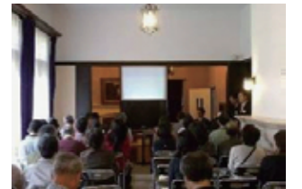
「旧華頂宮邸の魅力を学ぶ」(H23)