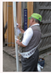
協力員による除却の様子