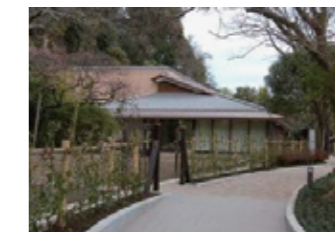
川喜多映画記念館 (H19~H23)