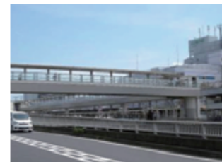
大船駅西口歩行者デッキ及び大船駅西口交通広場 (H19~H23)

都市の骨格を形成し、景観形成上特に重要な公共施設を景観重要公共施設【海浜ベルト・若宮大路ベルト・北鎌倉ベルト・柏尾川ベルト】に指定し、その整備と占用許可等の基準を定め、デザイン調整を行っています。