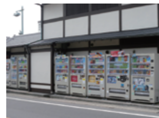
推奨カラーの自動販売機 (推奨カラー：5Y7.5 / 1.5)

業界団体の協力を得て、市民や観光客等の人通りが多い場所等において、色彩や配置方法等について独自の工夫が行われています。