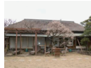
野尻邸 (旧大佛次郎茶亭) (指定第30号)