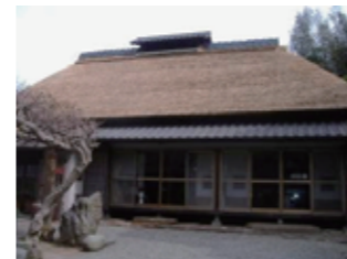
成瀬家住宅 (指定第32号)

明治から昭和にかけて建てられた洋風建築物が多く残されており、平成2年に「鎌倉市洋風建築物の保存のための要綱」を定めました。平成8年には、「鎌倉市都市景観条例」を施行し、これまでの洋風建築物に加え、和風建築物や門、塀などの工作物を「景観重要建築物等」として指定し、保存と活用を図る制度を設けました。平成22年には、景観法に基づき、「景観重要建造物」の指定を行いました。