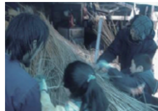
茅葺き体験 (成瀬家住宅)

茅葺き修理に携わっている職人の皆様から直接指導を受けて、茅葺き体験や藁を使った縄作り体験を行いました。また、茅葺き屋根に関する絵本の読み聞かせも行いました。