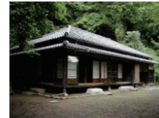
旧川喜多邸別邸 (旧和辻邸) (景観重要建造物：指定第1号)