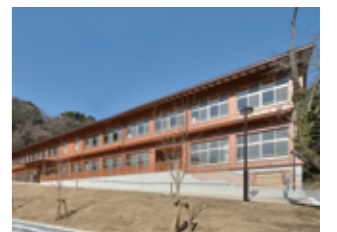
鎌倉市立第二中学校 (H19~H23)