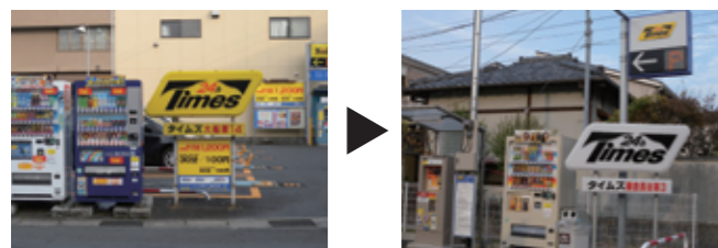
地色を黄色から白色に変更。広告塔のデザインを縮小。