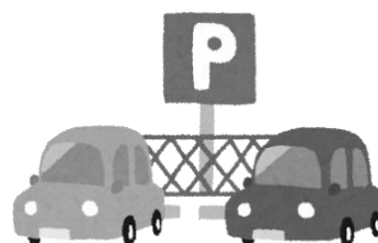
低未利用の土地・建物を譲渡