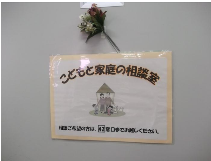
こどもと家庭の相談室