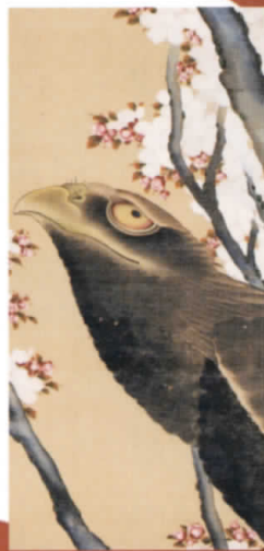
桜に鷲図 Eagle and Cherry Blossom