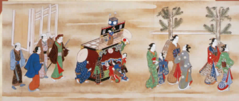
奥村政信「当流遊色絵巻」(上巻)