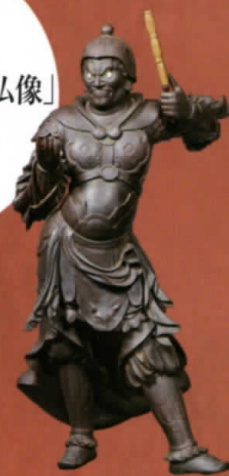
十二神将立像 (鎌倉国宝館蔵)