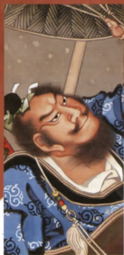
雪中張飛図 Zhang Fei in Snowfall