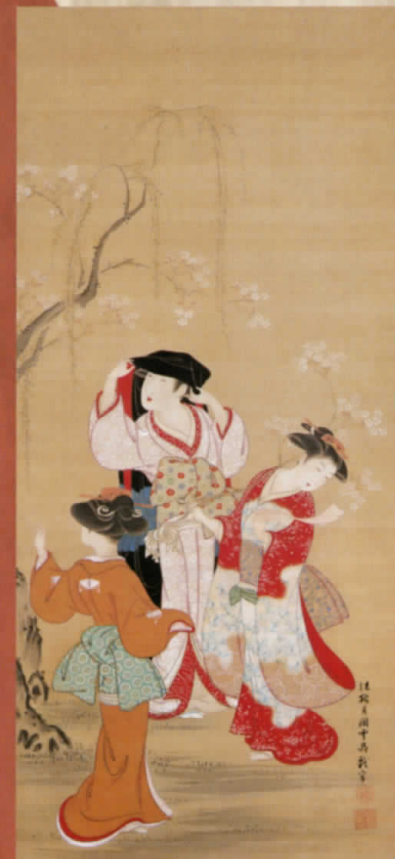
月岡雪鼎「しだれ桜三美人図」