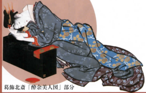
葛飾北斎「酔余美人図」部分