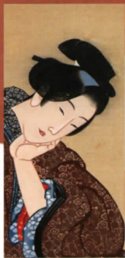
若衆文案図 Young Man Writing a Letter