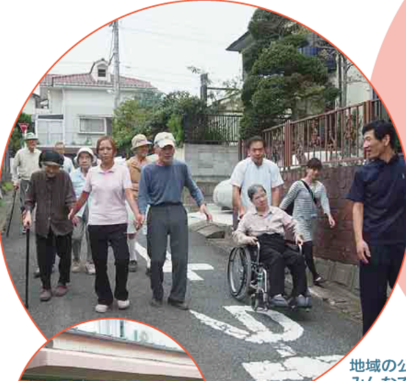
地域の公園へ みんなで散歩