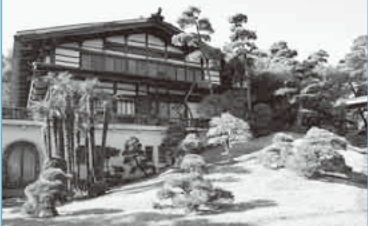
扇湖山荘は、製薬会社創業者の別荘として建てられ、平成22年10月、本市に寄贈されました。

☎往復はがきに希望の日と部、代表者の住所・氏名・電話番号、参加人数(4人まで)を書いて、10/28(消印有効)までに都市景観課へ。抽選。結果は11月上旬にお知らせします