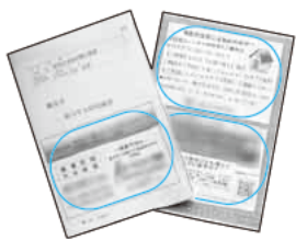
青い線で囲んだ部分が広告