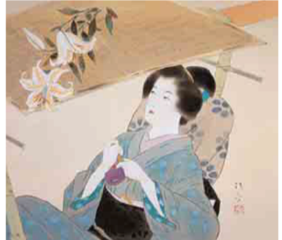
美人四季 山百合(夏) 昭和25(1950)年 東京富士美術館蔵

戦禍により東京の家を焼失した鏑木清方は、昭和21(1946)年、疎開先の御殿場から鎌倉の材木座へと移り住みました。 文化勲章を受章した昭和29(1954)年には、雪ノ下(当館所在地)に居を構えます。「内に居れば閑静で、戸外へ出れば賑やかなところ」を求めた清方は、「ここを終の棲家」とし、93年の生涯を閉じるまで17年余りを過ごしました。 清方が雪ノ下に居を構えて60年にあたることを記念し、鎌倉に在住したころに制作した作品を中心に紹介します。 とき:5月21日(水)まで 午前9時~午後5時(入館は4時30分まで) 休館日:月曜日(4月28日と)