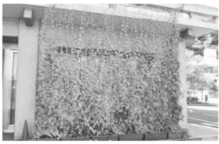
本庁舎でも毎年、緑のカーテンを設置しています

「緑のカーテン栽培講座」を開催し、受講者にゴーヤの苗を無料配布します(1世帯4株程度)。植物で建物の壁や窓を覆う