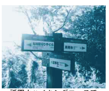
祇園山ハイキングコースで

また、水質検査は、名越・今泉クリーンセンターと関谷最終処分場でpH(水素イオン指数)、重金類、有機塩素系化合物、農薬類について調べました。結果はすべて基準に適合していました。