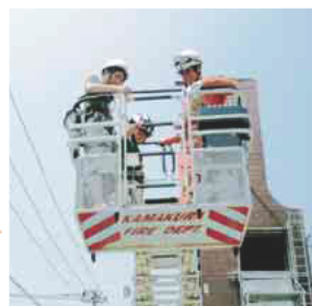
はしご車体験乗車