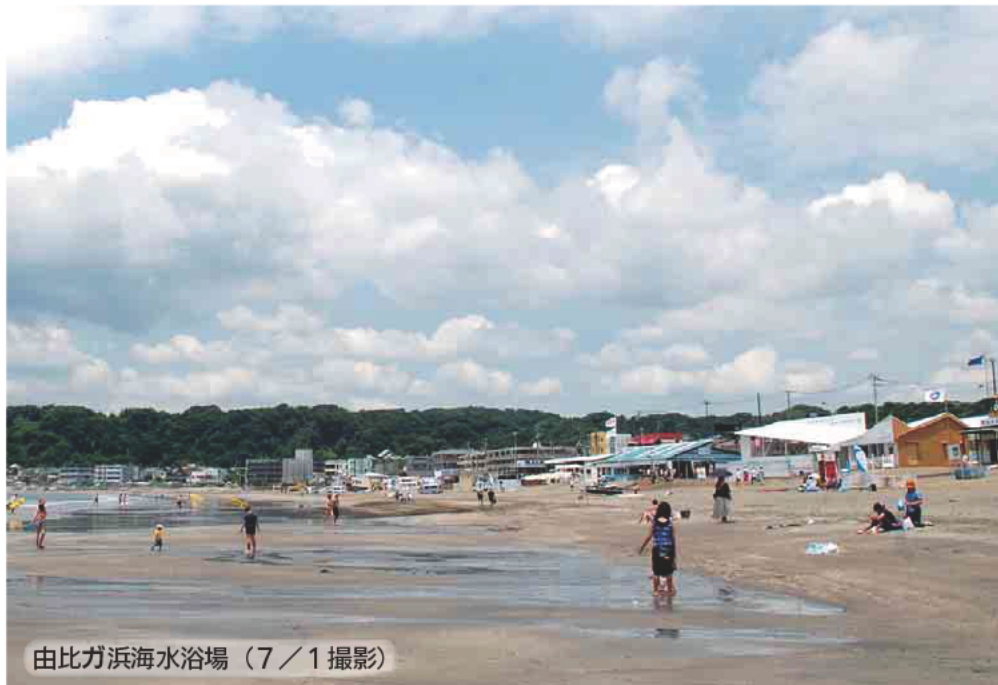
由比ガ浜海水浴場(7/1撮影)