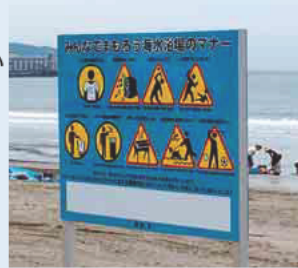
迷惑行為の防止を呼び掛ける看板