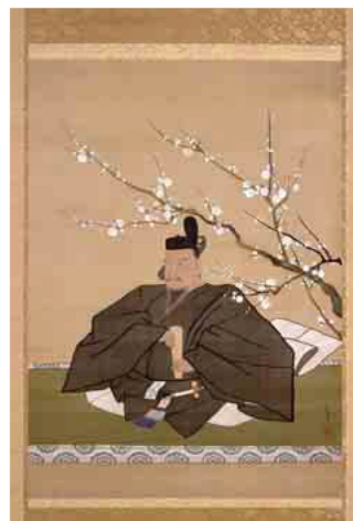
束帯天神像 酒井抱一筆(常盤山文庫蔵)