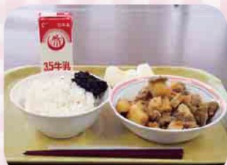
海苔(のり)の佃(つくだ)煮も手作りです