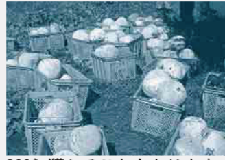
800* 0 獲れることもあります

市内の遊休農地を有効利用するため関谷の農地で作られた野菜を、学校給食で使っています。 平成18年に「遊休農地解消対策協議会」が設置され、関谷の農地で野菜を作り市内の施設に配布する取り組みを開始しました。 これまでに、カボチャ、ミニトウガン、サツマイモ、ムラサキイモ、ベニアズマなどの遊休農地で作られた野菜が、小学校給食で使われてきました。 今年も9月に、地場産のトウガンを使ったおかずが給食になりました。