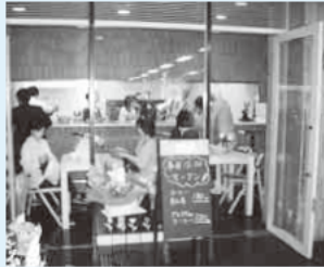
10/1のオープンの様子