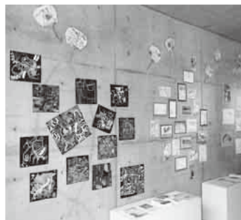
3歳から91歳の個性が光る作品展

児から高齢者まで、認知症や障がいがある人もない人も一緒に制作体験する機会を提供しています。「臨床美術」は、心理系アートセラピーのように絵で診断はせず、ただ純粋に表現する、とにかく楽しいアプローチです。子どもの感性教育、高齢者の介護予防や認知症のりハビリ、社会人のメンタルヘルスケアなどにも取り入れられ、美術はもちろ