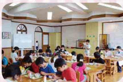
ランチルームでの会食