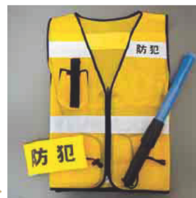
貸し出し用の防犯グッズ