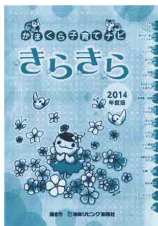
平成26年度版の「きらきら」

来年4月発行の「きらきら」へ掲載を希望する場合は、12/10(水)までに申込書を提出してください。メディアスポットのホームページへの掲載は随時行っています。詳しくは市ホームページをご覧ください。