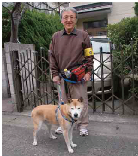
わんわんパトロール活動広報隊員・菊次郎号

申請書に記入した犬の写真と犬の首輪の写真を添えて郵送、Eメールか直接市民安全課(第3分庁舎) anan@city.kamakura.kanagawa.jp へ。申請書はホームページで入手するか、電話で請求してください。