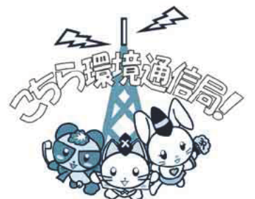
かまくら3R推進キャラクター (ぼん太・にゃん丸・ひめ)

同連合会会員は、地域のコミュニティ活動のために使用することができ、 ☎同連合会事務局(腰越支所内) ☎33局0710