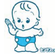
国勢調査イメージキャラクター

国勢調査は国内の人口・世帯の実態を明らかにすることを目的として行われる、国の最も重要な統計調査です。日本に住んでいるすべての人と世帯を調査対象として、5年ごとに行っています。ご協力をお願いします。