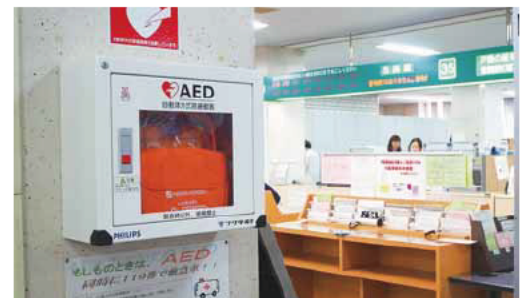
市役所本庁舎に設置されているAED

AEDマップは、市ホームページで確認できます。また、119番通報の内容によりAEDが必要だと判断したときは、指令室のオペレーターが通報場所の近くにあるAED設置場所を案内します。