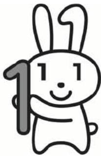
マイナンバー キャラクター マイナちゃん

マイナンバー(個人番号)とは、国民一人一人が持つ12桁の個人番号のことです。マイナンバー制度(社会保障・税番号制度)は、社会保障、税制度の効率性・透明性を高め、国民にとって利便性の高い公平・公正な社会を実現するための社会基盤です。詳細は、本紙10月1日号でお知らせします。