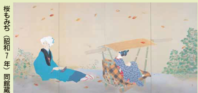
桜もみち(昭和7年) 同館蔵