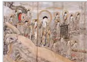
国宝「当麻曼荼羅縁起絵巻」光明寺蔵

1/17に玉縄学習センター分室で絵巻物や仏画、水墨画などについて講義を行います。鎌倉国宝館学芸員が会場に向く出張講座です。