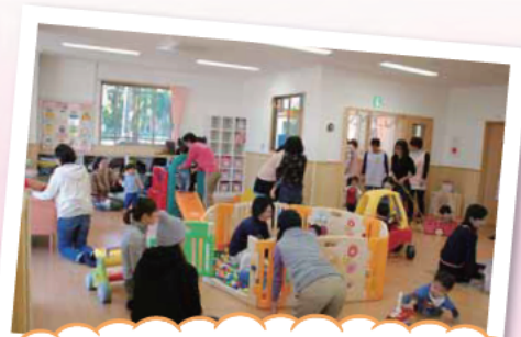
子育て支援センターの子育てひろば