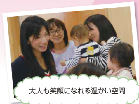
大人も笑顔になれる温かい空間

玉縄こどもセンターが11月4日にオープンしました。耐震対策で建て替えを行っていた岡本保育園と、子育て支援センターの機能を併せ持ち、玉縄地域の子育て拠点として、多様化するニーズに応じていきます。