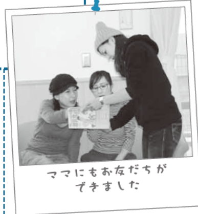
ママにもおなだちが できました

おはなしたい ぼんぼこぴーのおはなし会 読み聞かせや手遊び。 12/10(木) …10:30~11:00 かまくら五人姉妹の クリスマスコンサート 12/16(水) …10:30~11:15