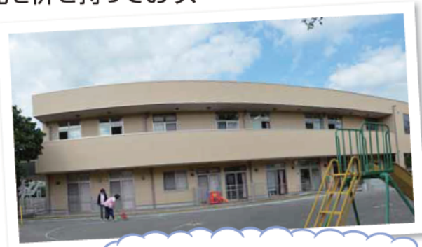
子どもたちが元気に遊べます