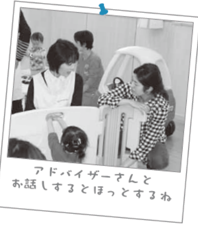
アドバイザーさんと お話しするとほっとするわ

●相談・問い合わせ 子育てで気になることや心配なことを ご相談ください。電話でも受け付けます。 平日…9:00~17:00