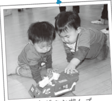
おなだちと遊んで 楽しかったよ

保育時間…平日7:00~19:00 土曜日7:00~18:00 定員…100人(0歳児8人、1歳児16人、 2歳児18人、3歳児18人、4歳児20人、 5歳児20人)