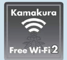
Wi-Fiスポットを示す目印

災害時に、市民や観光客が自分で情報などを入手できるように、市役所本庁舎(ロビー)、市役所第3分庁舎、鎌倉生涯学習センター(ロビー)に無線LAN(Wi-Fi)を整備しました。これらの施設は、大規模な災害時には防災拠点となります。なお、平常時には一定条件のもとでWi-Fiを使用することができます。