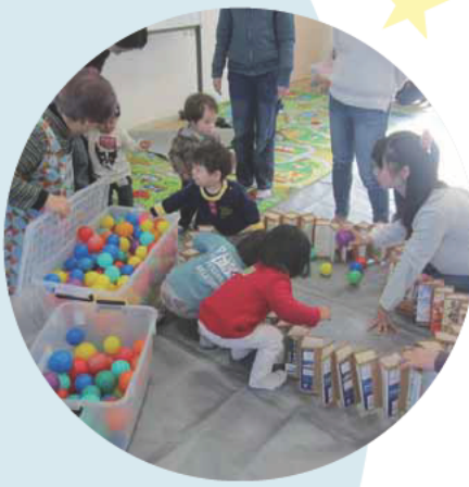
取り組みイメージ図

今後は、町内会では従来通り住民の安心・安全とコミュニケーションづくりを、NPO法人では専門性が高く、長期的な活動を要する取り組みを担っていきたく考えています。