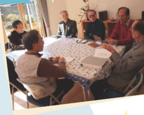
町内会とNPOで地域を運営