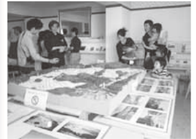
大勢でにぎわう文化祭会場

平成25年度から、地域の人材発掘とコミュニケーションづくりを目的に年に1回文化祭を開催しています。町内会館と隣接する公園や商店街で作品を展示しています。