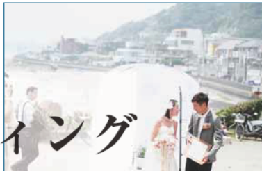
平成25年に鎌倉ウエディング実施の小室夫妻