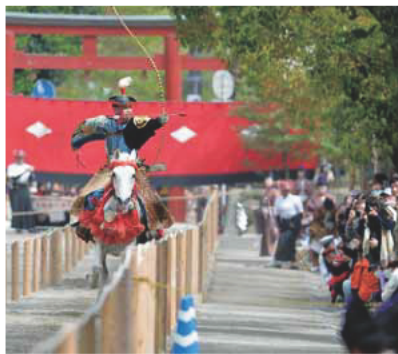
流鏝馬(左)と静の舞

鎌倉の春を彩る「鎌倉まつり」が始まります。静の舞、流鏝馬、野点席のほか、段葛の改修工事の完成を祝して記念行列も実施します。