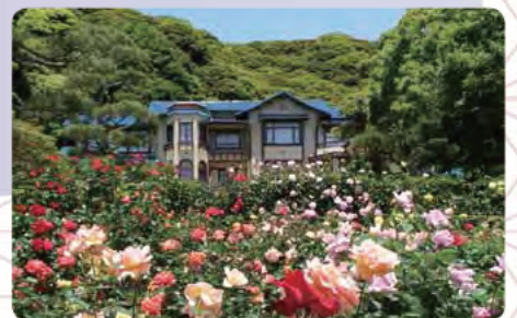
同・鎌倉文学館 (旧前田家鎌倉別邸)

明治時代に入ると、横須賀線などの開通に伴い、政界人や財界人などが訪れるようになり多くの別荘が建てられ、これを契機に、鎌倉は近代都市としてのまちづくりが進められた。