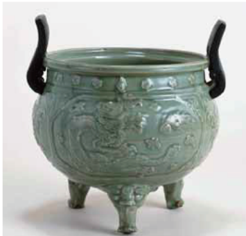
せいじちようかりゆうぼたんもん 青磁貼花龍牡丹文 大香炉 一口

青磁貼花龍牡丹文大香炉は、中国の元の時代に浙江省龍泉窯で焼かれたとみられる青磁で、執権北条時頼から建長寺に寄進されたものと伝えられています。 やや赤みがかった磁土に化粧土が塗られ、その上に明るく淡い青磁釉が厚くかけられています。両耳は欠けたのちに別材で補われて