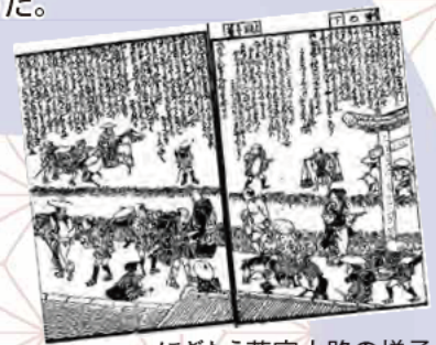
にぎわう若宮大路の様子 ([「諸国道中金の草鞋」より])