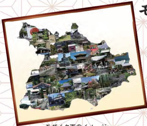
モザイク画のイメージ (54の構成文化財を組み合わせています)