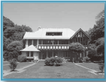
構成文化財・旧華頂宮邸