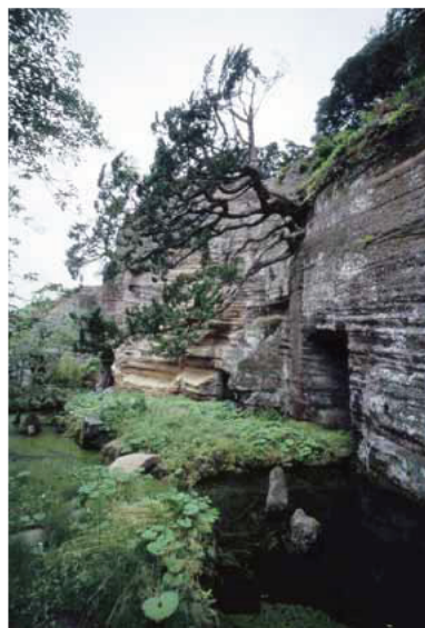
浄光明寺 庭園切岸

神奈川県横浜市、逗子市、鎌倉市の4市では、「武家の古都・鎌倉」の世界遺産登録への推薦取り下げ後、「鎌