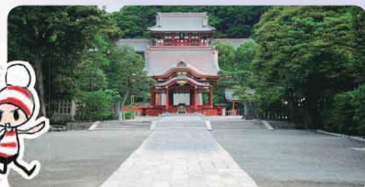
構成文化財・鶴岡八幡宮

源頼朝が幕府を開き、本格的な武家政権が誕生した地である鎌倉は、幕府によって急速に都市整備が進められ、鎌倉のまちの基本構造は鎌倉時代にほぼ確立した。