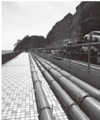
歩道上に仮設した送水管

引き続き、圧送管の本復旧に向けて取り組んでいきます。最新の情報は市ホームページで確認できます。