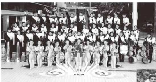
鎌倉女子大学中等部・高等部マーチングバンド