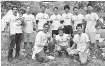
学校法人清栄学園七里が浜楓幼稚園「かえでPapas」