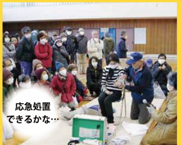
応急処置 できるかな…