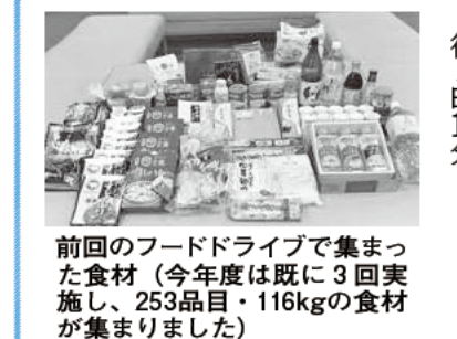
前回のフードドライブで集まった食材(今年度は既に3回実施し、253品目・116kgの食材が集まりました)

フードドライブ を実施します！ 食材を消費しないまま捨ててしまう「食品ロス」が社会問題となっています。そこで、食品を使いたい人へ引き渡す「フードドライブ」を実施します。 今回募集する食材は、市民団体が開催する福祉行事などで使用します。 募集する食材：缶詰類、野菜(主に根菜類)、調味料(食用油など)、飲料(ジュースなど)、米類、乾麺、贈答用ハムなど。少量でも可。