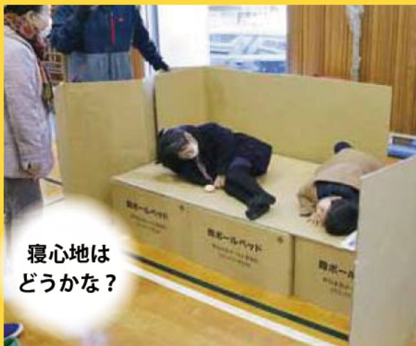
寝心地は どうかな?