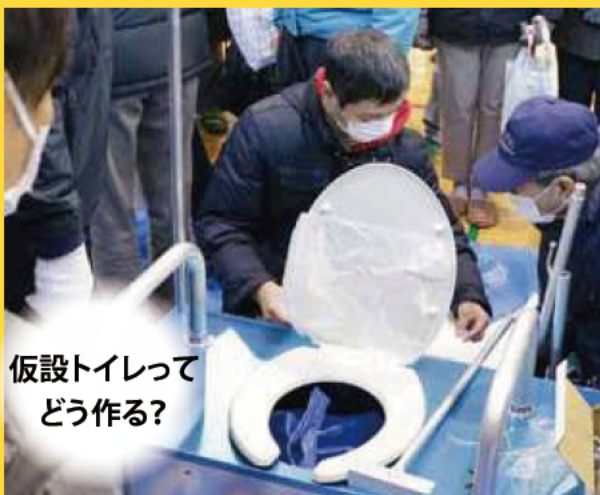
仮設トイレって どう作る?