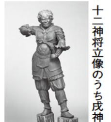
十二神将立像のうち戌神

同館で開催中の特別展「北斎と肉筆浮世絵」に合わせ、江戸時代の三味線演奏者などを招いた演奏会を開催。時間は17:15～19:00。定員25人。抽選。小学生以下は保護者同伴。■☎で☎を3/13までに同館(☎kokuhoukan@city.kamakura.kanagawa.jp)へ