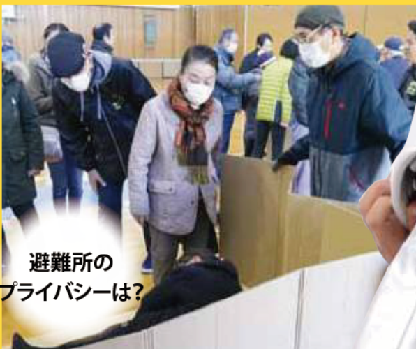
避難所の プライバシーは?