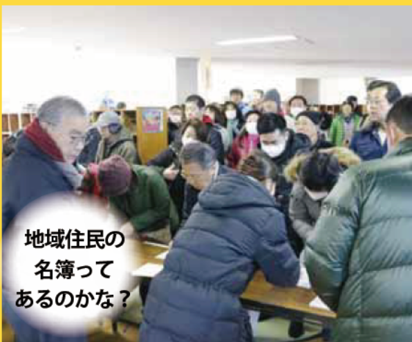
地域住民の 名簿って あるのかな?