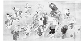
当流遊色絵巻(奥村政信)