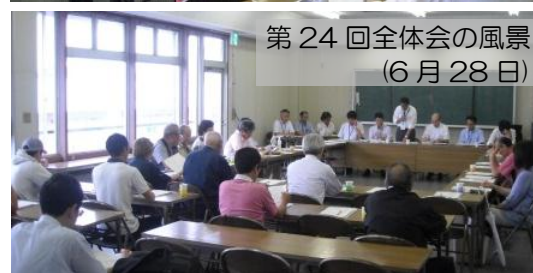
第 24 回全体会の風景 (6 月 28 日)