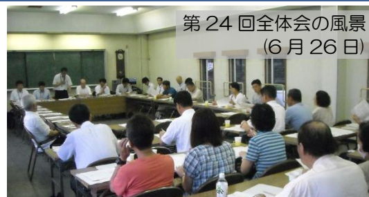
第 24 回全体会の風景 (6 月 26 日)