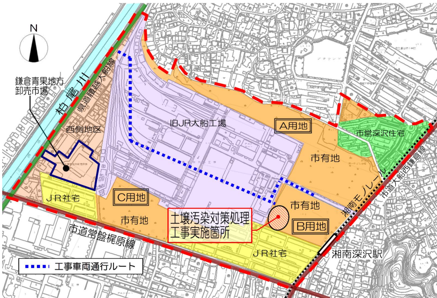
土壌汚染対策処理工事実施箇所図