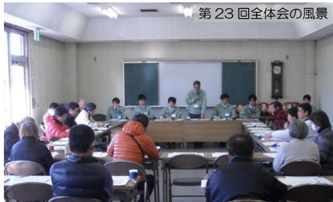
第 23 回全体会の風景