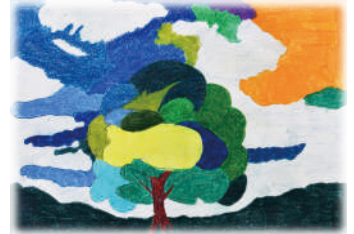
『カラフルな木』みずちゃん/道工房