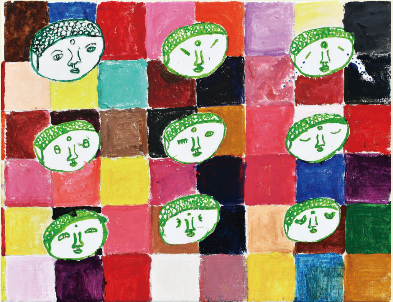
『色々な大仏様の表情』村田 恭一/ 道工房