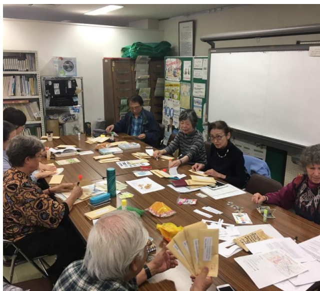
月 1 回開催される例会の風景

鎌倉グループは 1988 年に、多国籍の人たちによって結成されました。主に鎌倉生涯学習センターで開催される例会では、人権侵害の被害者のケースを取り上げてその政府に手紙を書く作業などを行っています。その他、地域イベントに参加したり、独自に講演会・映画上映会を開催して人権の啓発活動を行っています。手紙を出すことで不当に拘留されている人が釈放された事例も報告されています。お問い合わせをいただければ、例会へお誘いします。