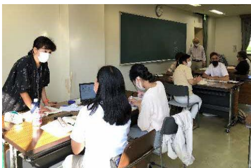
<再開された対面教室 2022年10月>

まず教える側が学習。オンラインとはどんなものかに始まり、いかに授業をするかを学び、研修会を持ち、何とか授業を続け、再開のチャンスを待ちました。先生方のオンライン歴もばらばらで、初めての経験に悪戦苦闘する方もいました。それでも使い慣れている方に助けられ新しいことを学びました。生徒の新規募集も制限せざるを得ない中、帰国や引っ越しなどで生徒数は減少の一途。2022年12月中のみ募集いたしました。