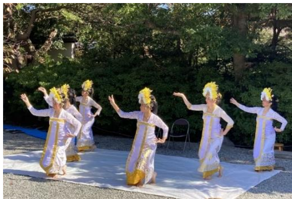
<和楽会・湘南打々鼓>