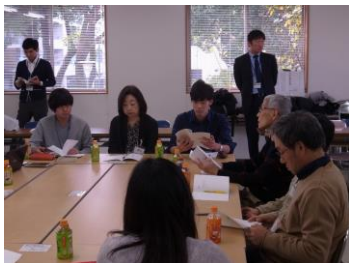
読み合わせ・意見交換の様子