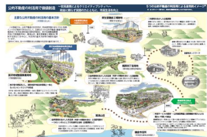
『中間取りまとめ』での公的不動産利活用イメージ

『公的不動産利活用推進委員会』での検討経過を広く分かりやすく市民に知っていただくために『中間取りまとめ』を作成・公表し、周知に努めました。また、再編計画全般や市役所本庁舎整備等も含めた検討についての更なる周知・理解を進めるため、自治町内会等で職員が説明し、意見交換等を行う『出前講座』(計42回、延べ818名)を重ねるとともに、パブリックコメントを実施しました。