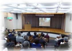
まちづくり市民シンポジウムの様子(第3回市民対話)

また、取組に関する周知・理解を進めるため、継続的に『市民対話』を実施し、外部講師の講演を参考に、鎌倉市のまちづくりについての市民の意見聴取に努めました。第1,2回は講演後にグループ形式で対話を行い、第3回はシンポジウム形式で講演やパネルディスカッションを行いました。『市民対話』(まちづくり市民シンポジウム含む)では、「公的不動産の利活用検討の取組についてもっと周知に取り組んでほしい」、「新しい本庁舎は市民交流として知識の共有や市民が活動できる場、防災対策の促進の場としてほしい」などの意見