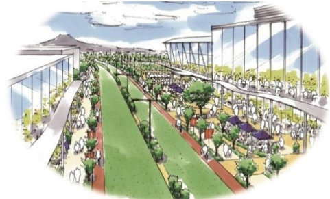
深沢地域整備事業用地(行政施設用地)の利活用後のイメージ(具体的な整備計画を表したものではありません。)

基本方針の検討に当たってはサウンディング型市場調査※を実施し、鎌倉のまちや地域の価値を高めていくといった理念「パブリックマインド」を持った民間事業者等との連携を目指すため、公的不動産の利活用のアイデア(利活用の方法、事業手法など)について民間事業者等との「対話」を行いました。