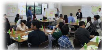
市民対話（協働・拡張ワークショップの様子）

本庁舎整備の方針（現在地建替え・現在地長寿命化・移転）を策定するため、学識経験者と各種団体の代表者で構成する『本庁舎整備方針策定委員会』を設置し、公開の場で一年間検討を重ねました。また、これと並行して無作為抽出による市民や市内の生徒・学生の参加による『市民対話』を約半年にわたって行うとともに、広く市民の皆さんに参加を呼び掛けた『市民対話（協働・拡張ワークショップ）』を開催するなど、市民の意見聴取に努めました。『市民対話』（協働・拡張ワークショップ含む）では、「市民が集える機能がほしい」、「災害に強い場所に建てるべき」、「皆がそこで働きたいと思う魅力的な職場であってほしい」などの意見がありました。