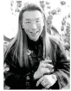
假屋崎 省吾 氏(元祖華道家)

東京・銀座【假屋崎省吾 花教室】主宰。「美をつむぎだす手を持つ人」と評され、各国首脳来日歓迎や天皇在位10年記念、天皇退位・即位など多数の花制作を手掛ける。女子美術大学・客員教授、フランス観光親善大使、オランダチューリップ大使などを務め、花と建物のコラボ個展“歴史的建築物に挑む”を国内外で開催。「花育活動」や「少子化問題」などの社会活動も積極的に取り組み、今年、華道歴40周年を迎え、益々活躍の場を広げている。