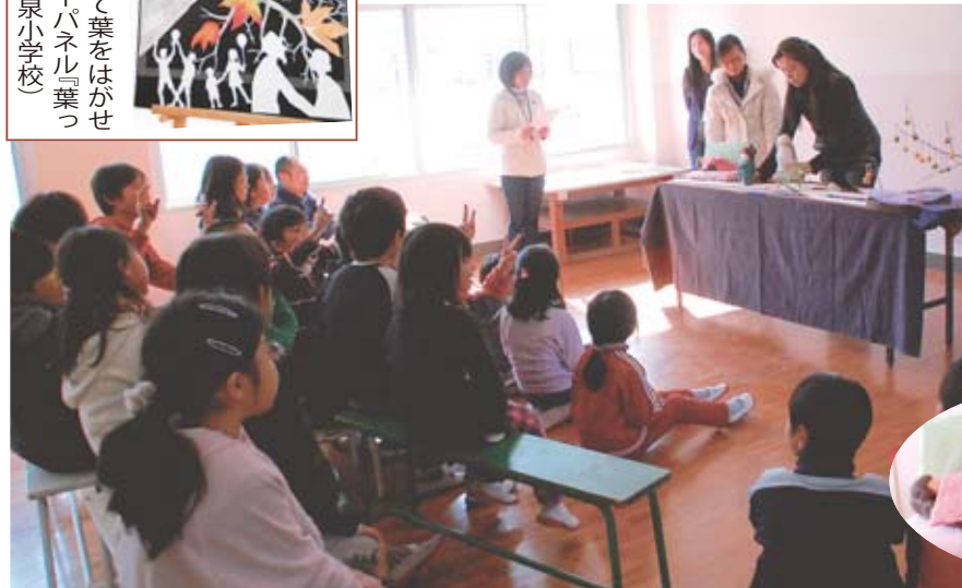
昼休みに行う手作りシアターを使った読み聞かせ(月に1回)も好評です。写真は岩手の民話「なら梨とり」。(今泉小学校で)