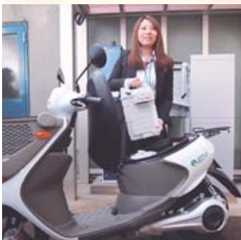
手にしているのがバッテリー。後方はロッカー式ステーション

実証実験では、市を含む約20の事業者が30台のバッテリー交換式の電動バイクを運用しながら、バッテリーの共同利用実験を行っています。市としても電動バイク5台を公用車として運用し、この事業に協力しています。3月まで、市役所本庁舎や