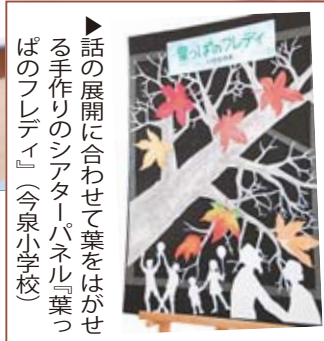
話の展開に合わせて葉をはがせる手作りシアターパネル『葉っぱのフレディ』(今泉小学校)