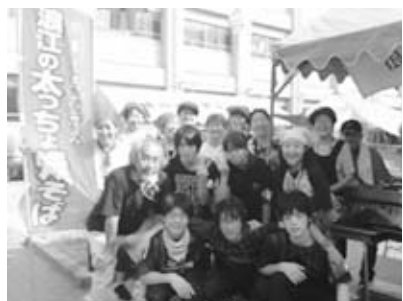
高校文化祭での活動の様子