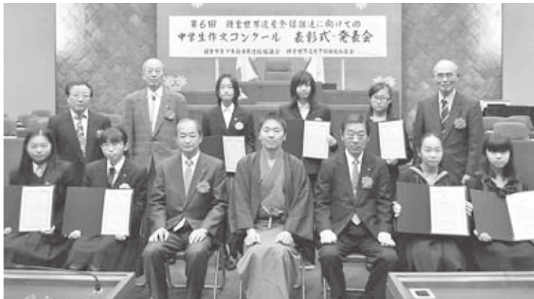
入賞者表彰式・発表会 (1/19 市議会本会議場)

った。もちろんとても歩きにくくて、幼い頃には父の手を借りながらようやく歩けた坂だった。ただ、そんな道を通るからこそ、自分は鎌倉時代の武士たちも通った道を歩いている、という気持ちになれる。私はそんな歴史のある景色の中を歩くのが好きだ。だからこそ、初めて名前を意識しながら歩いた亀ヶ谷坂が、急な坂道であっても、道の両側には切りたつた崖があ