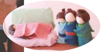
▲シアターに登場する保護者手作りの人形。お母さん(左)の病気を治すため、梨を取りに行くことにした兄弟(右)。