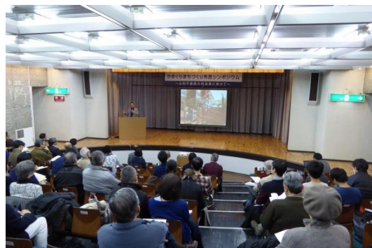
シンポジウム会場全体の様子