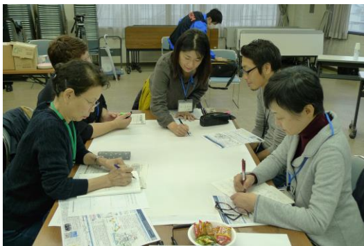
対話グループワークの様子