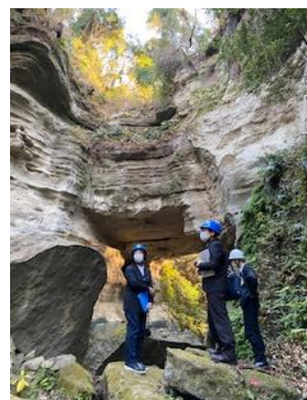
写真5-1 史跡大町釈迦堂口遺跡の現状

なお、保存活用計画や保存管理計画等が策定されていない文化財については、関係法令や条例に従って適切な保護の措置を講じていくこととし、未指定の物件については、必要