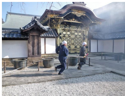
写真5-5 文化財所有者による消火訓練

鎌倉文化財防災連絡協議会に加盟している社寺については、その多くが年に数回専門業者による火災報知器点検や消火器点検を受けるとともに、機械警備を導入するなど、防災・防犯対策に努めている。今後は災害の歴史について研究している市の学芸員による講演の機会を設けるなど、情報交換の場としても活用できるようさらに取組を進めていく。同協議会に加盟していない社寺についても、その多くが防犯対策として、文化財の盗難や損壊等の犯罪に備え、セキュリティカメラや侵入センサー等の設置の他、有人警備などを行っていることから、要請に応じて必要な支援・連携を図ることとする。