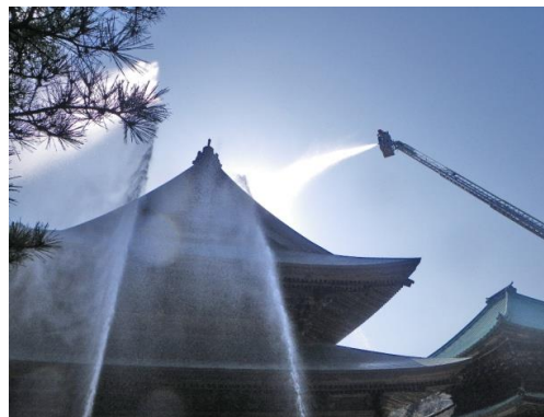
写真5-6 消防隊による延焼防止放水訓練

また、市消防本部では、文化財愛護と防火意識の高揚を図るため、毎年1月26日を含む一週間の「文化財防火デー」の期間中に、文化財保有社寺を対象とした立入検査や広報活動、社寺の協力を得て実施する消防訓練などの取組を通じて、引き続き文化財の保存・活用に向けた防災・防犯に努めていく。