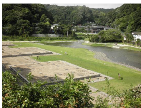
写真5-2 整備が完了した史跡 永福寺跡

重点区域の指定文化財に関する修理や整備についての具体的な計画としては、昭和56年(1981年)度から平成19年(2007年)度にかけて継続的に実施した発掘調査等の成果に基づき、平成29年度(2017年度)に史跡永福寺跡の環境整備事業を完了し、平成28年度(2016年度)からは史跡大町釈迦堂口遺跡の崩落対策及び公開活用に向けた整備を進めている。また、国指定重要文化財光明寺本堂について、令和元年(2019年)から令和10年(2028年)までの予定で大規模な修理工事を行っている。