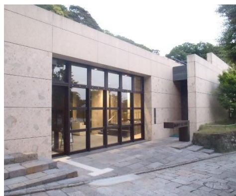
写真5-3 整備が完了した 歴史文化交流館の建物

併せて、鎌倉市にふさわしい博物館基本構想（令和2年6月策定）の考え方に基づき、資料の保存と活用に関