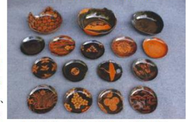
写真1-65 市内から出土した中世の漆器