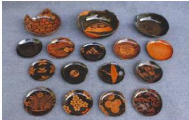
写真1-65 市内から出土した中世の漆器