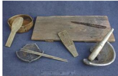
写真1-64 市内から出土した中世の生活用品 (左上から時計回りに曲物・杓文字、まな板・刀子・卸し板、すり鉢とすりこ木、卸し皿と箸)

鎌倉地域は、鎌倉幕府及び後続する鎌倉府の根拠地として中世都市を形成したエリアであり、周囲を取り囲む山稜部及び海浜部を含め、ほぼ全域が周知の埋蔵文化財包蔵地となっており、やぐら、社寺境内・社寺跡、都市遺跡その他の遺跡が濃密に分布している。このような豊富な埋蔵文化財が鎌倉の大きな特徴である。