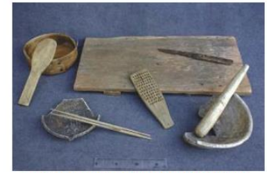
写真1-64 市内から出土した中世の生活用品 (左上から時計回りに曲物・杓文字、まな板・刀子・卸し板、すり鉢とすりこ木、卸し皿と箸)

鎌倉地域は、鎌倉幕府及び後続する鎌倉府の根拠地として中世都市を形成したエリアであり、周囲を取り囲む山稜部及び海浜部を含め、ほぼ全域が周知の埋蔵文化財包蔵地となっており、やぐら、社寺境内・社寺跡、都市遺跡その他の遺跡が濃密に分布している。このような豊富な埋蔵文化財が鎌倉の大きな特徴である。