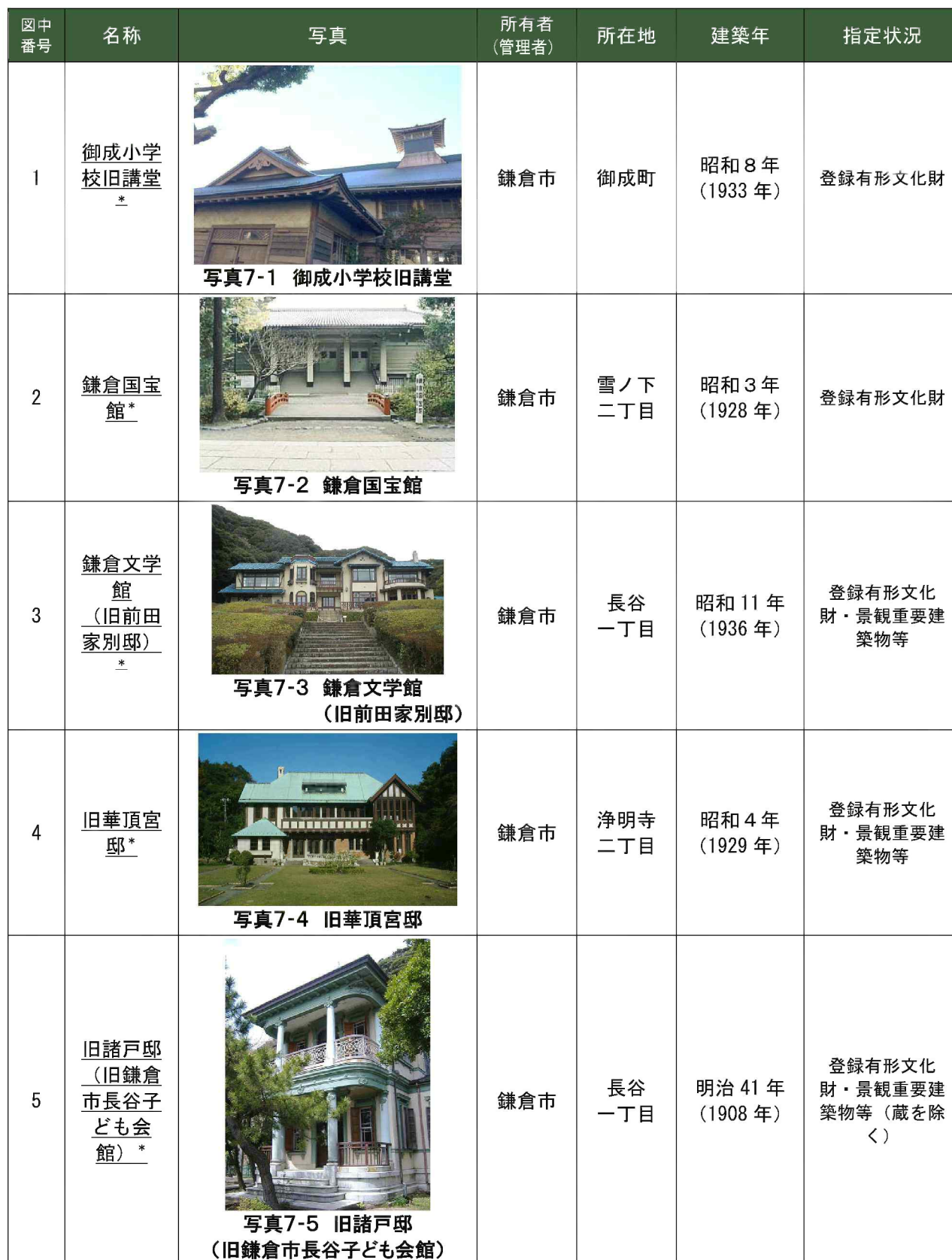
表7-1 歴史的風致形成建造物 候補一覧

歴史的風致形成建造物の指定が想定される建造物は次のとおりである。第1期計画において歴史的風致形成建造物に指定したものは下線及び「*」を付記している。