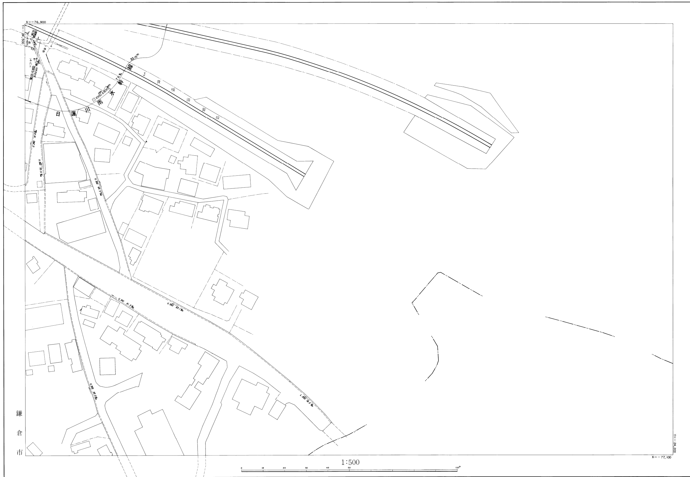
NO. 31 GH=13.851