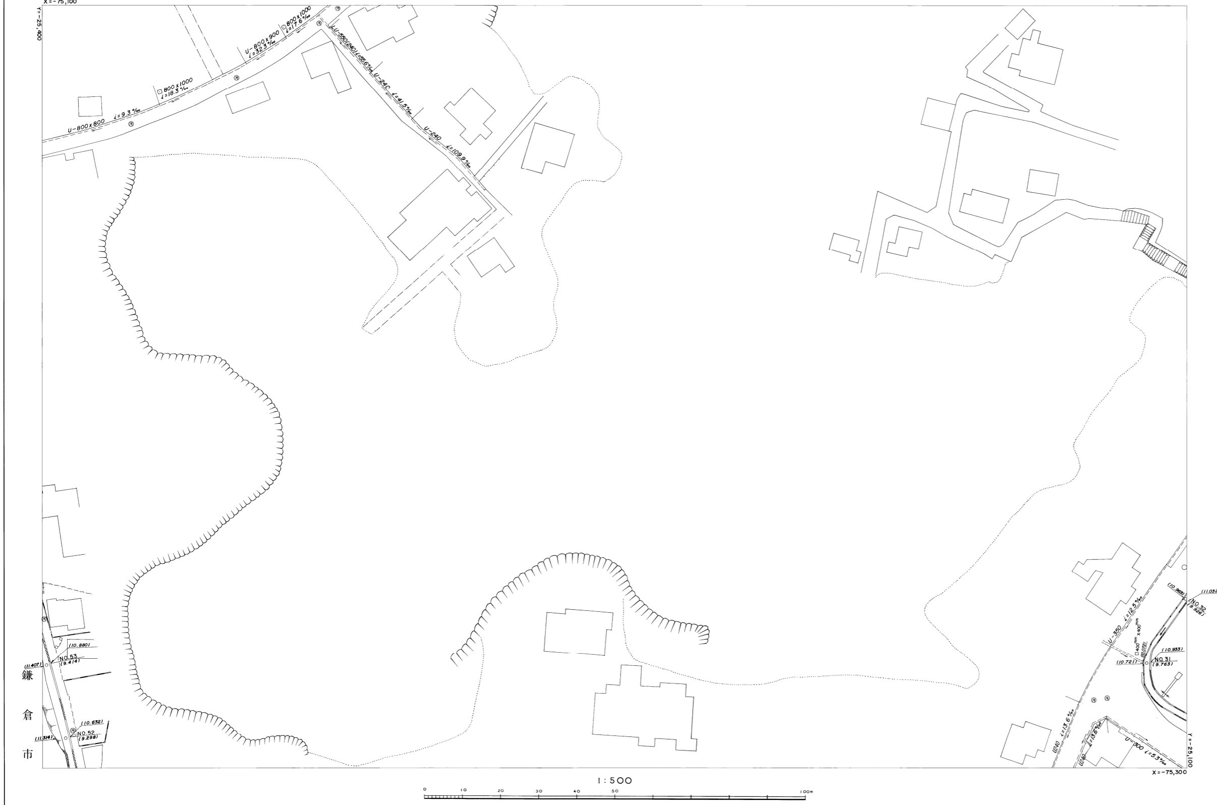
第2幹線 NO.31 GH=9.763