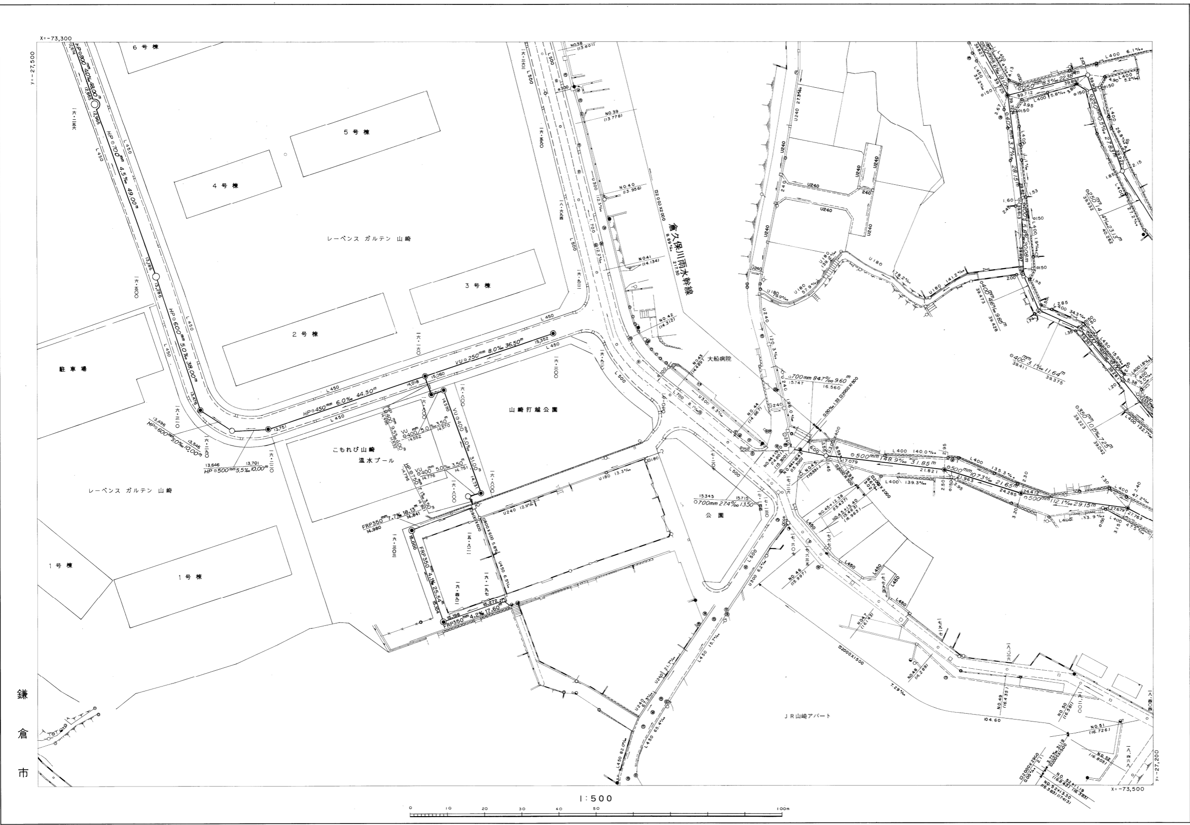
倉久保川雨水幹線 NO. 46 GH=15.997