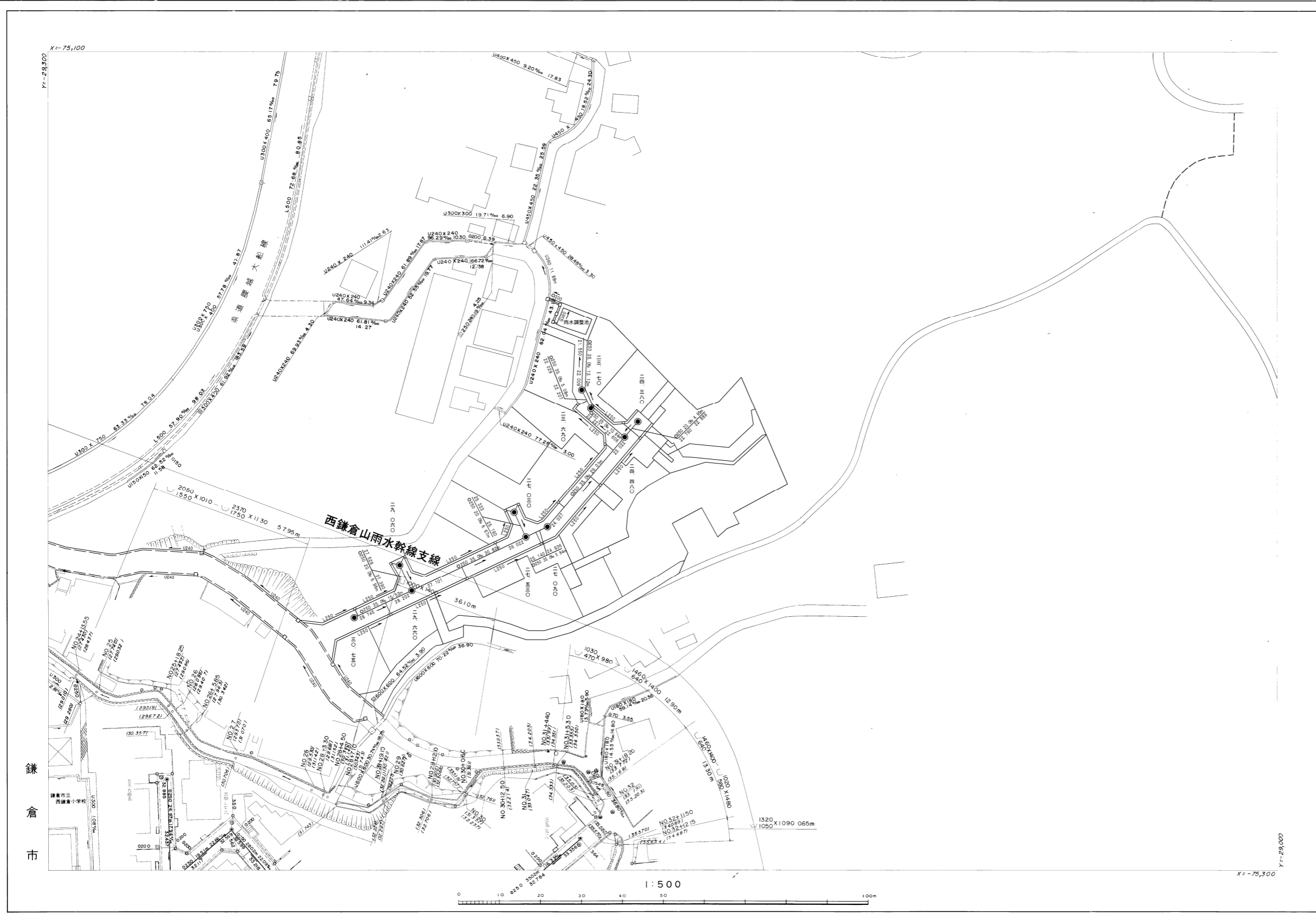
西鎌倉山雨水幹線支線