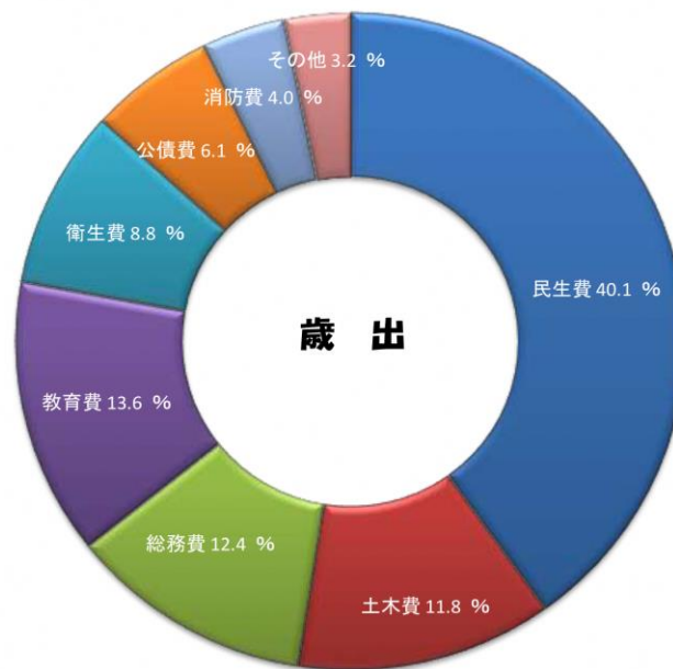
令和4年度一般会計予算グラフ表