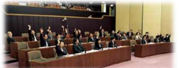
委員会修正案の採決の様子