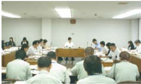
決算等審査特別委員会審査風景