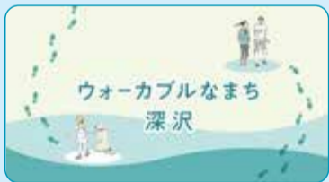
情報発信をしている市広報サイトから引用