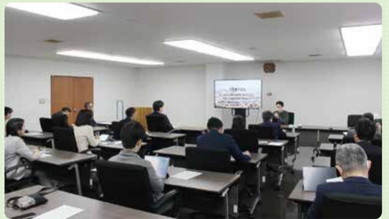
議員研修会の様子