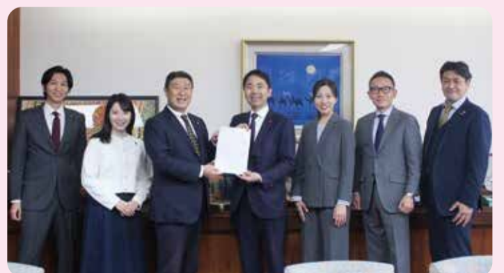
本会議で結果報告を行い、後日、市長に報告書を提出しました。

詳細は、議会インターネット中継の録画映像または6月上旬作成予定の会議録をご覧ください。