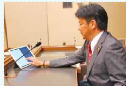
本会議場議長席での様子

鎌倉市議会では、紙使用量の削減、業務の効率化等を目的に、議会ICT化に向け検討を行った結果、平成28年12月定例会からペーパーレス会議システムを導入します。