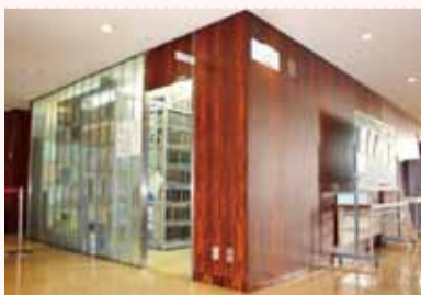
議会図書室 (本庁舎2階議会事務局横)